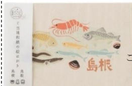
ご当地和紙の絵はがき 鳥取・島根 ¥1,000