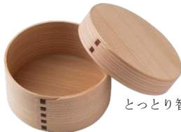
とっとり智頭杉の百年わっぱ ¥8,500