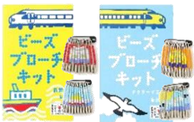
ビーズ ブローチキット 各¥550