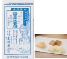
來間屋ひとくち糖 いち・に・さん色系 ¥600