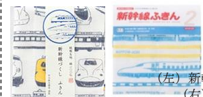
(左) 新幹線つくしふきん (右) 新幹線ふきん2 各¥550