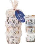
いつものおつまみ 三段土産 ¥1,400