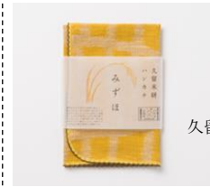
久留米緋ハンカチ みずほ ¥1,300