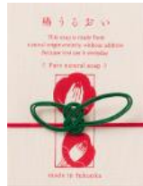
椿うるおい 洗顔石鹸 ¥3,000