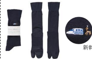
鹿のお父さん 新幹線の旅くつした ¥1,500