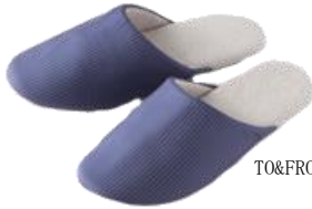
TO&FRO トラベルスリッパ ¥3,800