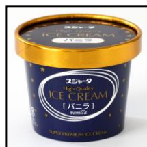
▲アイスクリーム（バニラ）