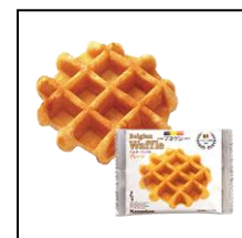
▲ベルギーワッフル