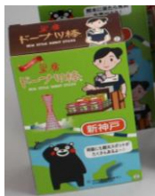
▲ドーナツ棒(車内販売オリジナルパッケージ)

ドーナツ棒：プラス120円、アイスクリーム（バニラ）：プラス250円、ベルギーワッフル：プラス100円