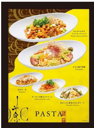
▲ランチや軽食としてご利用いただけるパスタやライスボウル等のフードメニュー