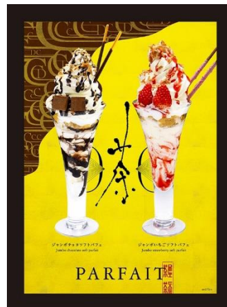
▲見た目にも鮮やかなパフェメニュー、水から一滴一滴抽出するダッチコーヒー