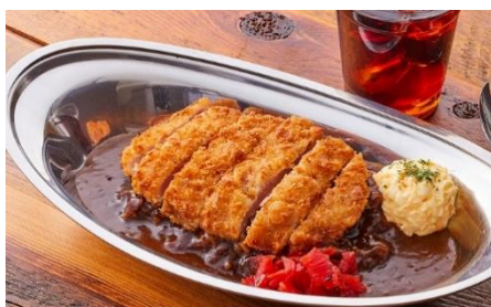
駅ナカ初 新大阪エリア初