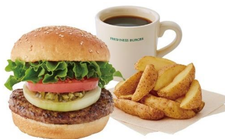
JR 西日本駅ナカ初 新大阪エリア初