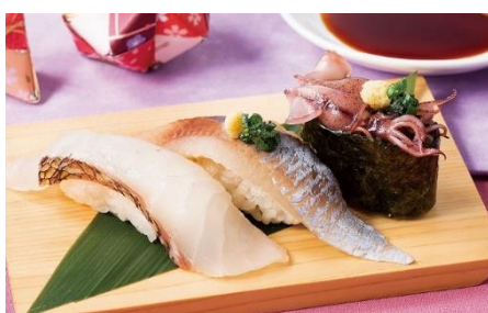
JR 西日本駅ナカ初 新大阪エリア初