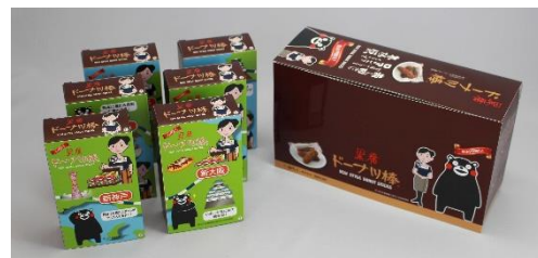
【黒糖ドーナツ棒 “山陽新幹線パーサー” バージョン】